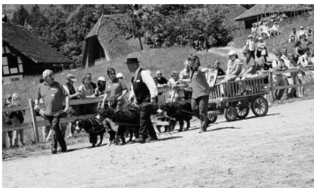
Ein herrliches Berner-Gespann, das die Zuschauer begeisterte.