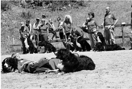
Bei sorgfältiger Gewöhnung und einem von gegenseitigem Respekt geprägten Verhältnis können Berner die besten Freunde der Kinder werden.