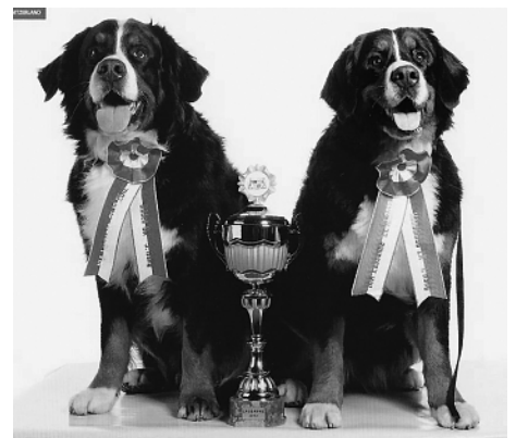
Eiko und Kimba vom Rickenwind, 2. Rang der Paarklassen