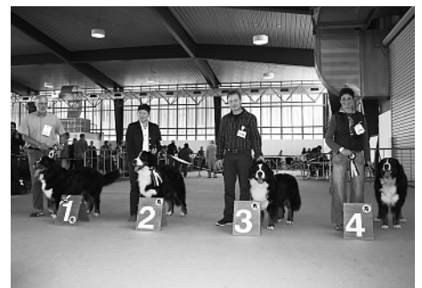
Die vier Rangierten der offenen Klasse Rüden

Paarklassen: Eiko und Kimba vom Rickenwind, 2. Rang