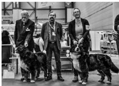
BOB und BOS vom 10. November 2018: Our Royal Chief No.7 Av Milkcreek und Öreghegyi-Mackó Panna Cotta