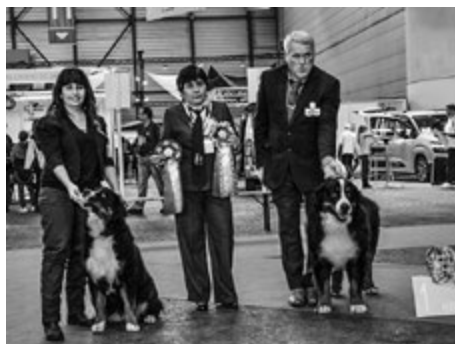
BOB und BOS vom 11. November 2018: Our Royal Chief No.7 Av Milkcreek und Queen Nala v. Gipfelfeuer

Das grösste Züchterverzeichnis der Schweiz – auch im Internet!