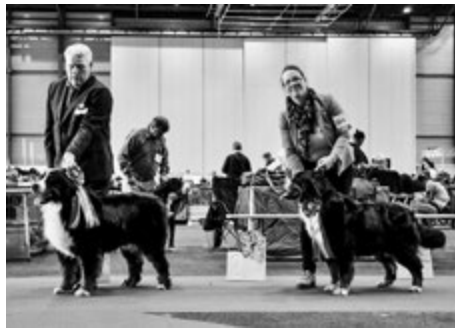
BOB und BOS vom 9. November 2018: Our Royal Chief No.7 Av Milkcreek und Öreghegyi-Mackó Panna Cotta