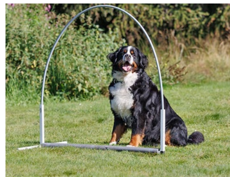
Dieses Jahr stand auch HoopAgi auf dem Programm.