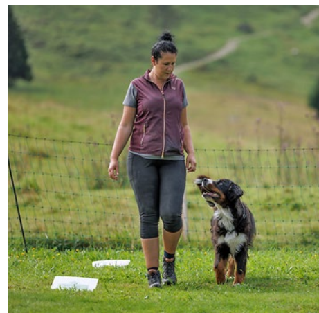
Schon fast zur Tradition gehört RallyObedience.