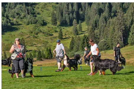
Morgendliches Einlaufen zu rassistiger Musik.

Jeden Morgen war von 9.00 bis 11.00 Uhr Training auf dem einzigartigen Trainingsplatz Tannenbodenalp angesagt. Danach standen Ausruhen, Mittag in der Alpkäserei oder Spaziergänge zur Auswahl. Jeweils um 18.30 Uhr trafen wir uns zum Abendessen und berichteten von unseren Taten. Verwöhnt wurden wir mit frisch gekochter Suppe, reichhaltigem Salatbuffet, grosszügigem Hauptgang und feinem Dessert, das gut gelaunte Service-Team tat das Seine dazu. Frei Haus geliefert, konnten wir während dem Essen die Abendstimmung des Bergpanoramas geniessen.